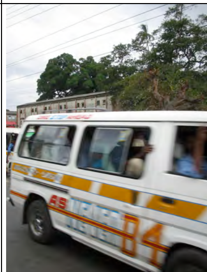
Ein Matatu kommt uns entgegen