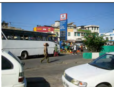
Straßenansicht mit Obstmarkt