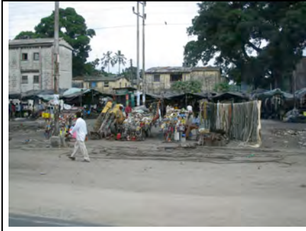
Plastik, Metall, Stoff, Leder, alles findet Abnehmer