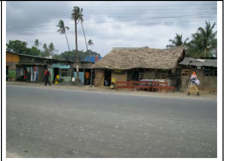
...und weiter geht's nach Miritini