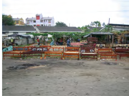
... für Bettgestelle...