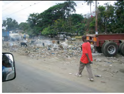
Müllbeseitigung durch Anwohner und Tier