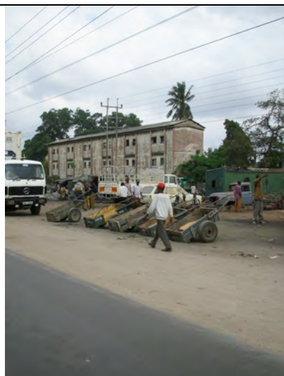
An der Straße warten Kleinlaster auf Arbeit