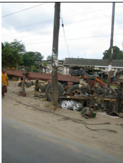
Hier wird alles weiter verkauft