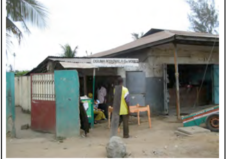
... für Tischmöbel, alles an der Straße!