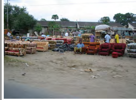
mit Angeboten für Polstermöbel...